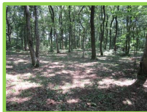
光が差し込む綺麗な平地林!